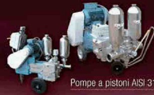
Pompe a pistoni AISI 316